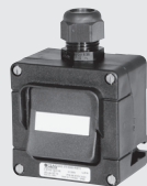
Łącznik / Przycisk